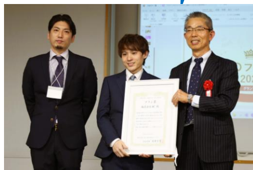
(CSOフォーラム2022 表彰式)