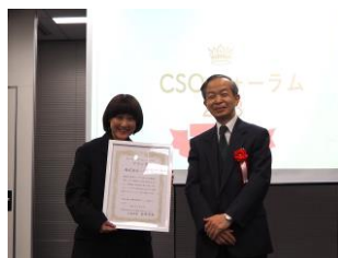
グランプリ賞 株式会社ハリイ