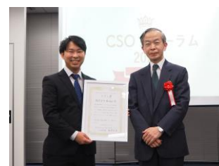
グランプリ賞 株式会社Redge