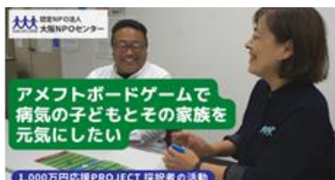
NPO法人 ホスピタルフットボール協会さん https://youtu.be/LrJMzUsoq6qQ